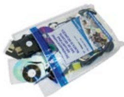
Security Bag für elektronische Datenträger, Versiegelung mit Sicherheitsklebestreifen