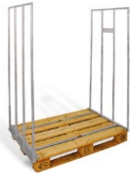
Bügelgebände für über-grosse Kartons