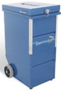
Sicherheitsbehälter (280 l) aus Stahlblech mit plombiertem KABA Star Sicherheitsschloss Platz für ca. 140 kg Akten