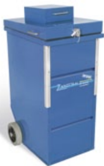
Sicherheitsbehälter für elektronische Datenträger aus Stahlblech mit plombiertem KABA Star Sicherheitsschloss