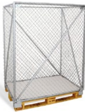
Netzgitter für Altpapier, Karton usw., fest auf Palette montiert