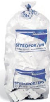
Füllstoffsack für Styropor, Schaumstoffe usw.