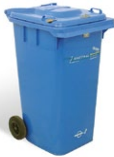
PL-Behälter (240 l) für Räumungen, abschliessbar Platz für ca. 130 kg Akten