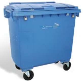
PL-Container (800 l) für Räumungen, abschliessbar Platz für 300 – 400 kg Akten