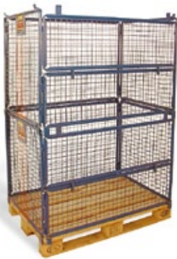
Steck-Doppelgitter für Altpapier, Karton usw., zusammenlegbar